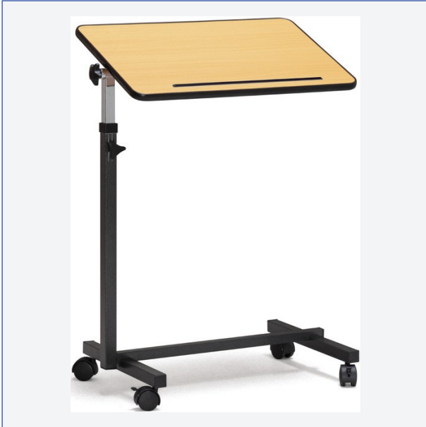
Table réglable pour lit ou fauteuil